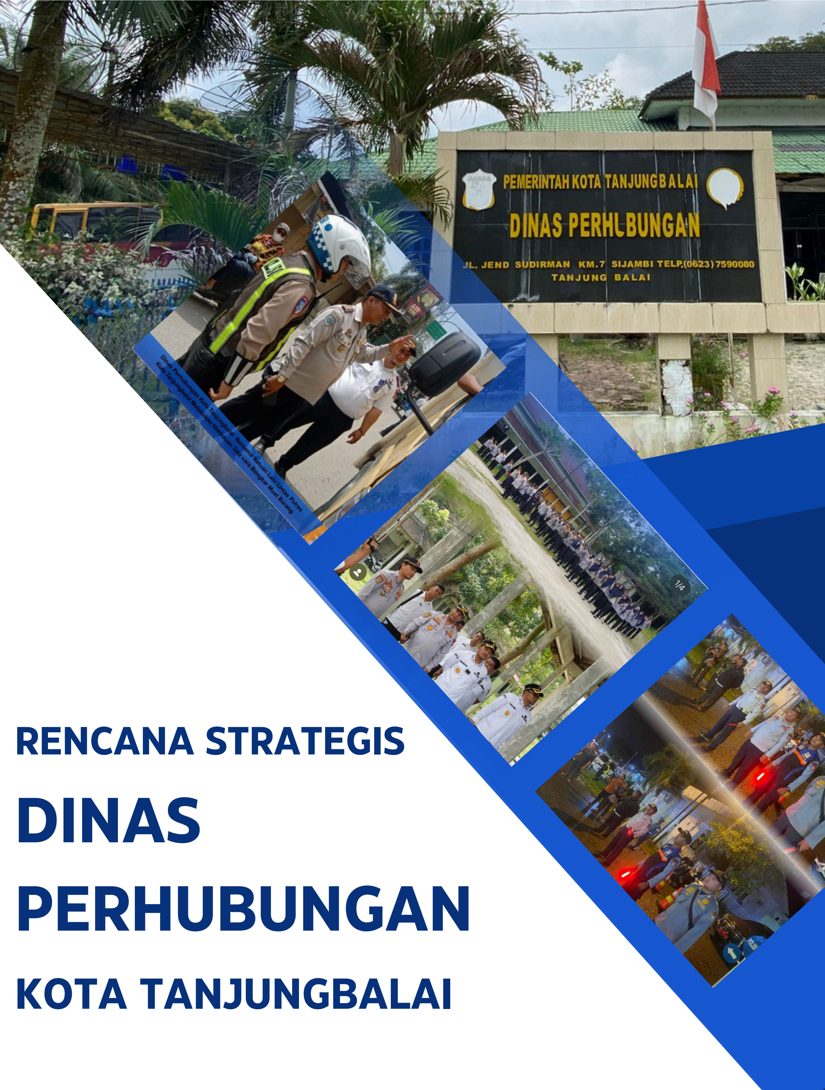
Dinas Perhubungan Kota Tanjungbalai Bersama Satuan Lalu Lintas Polres Kota Tanjungbalai Melakukan Hibawaan Tata cara Bongkar Muat Barang

PEMERINTAH KOTA TANJUNGBALAI DINAS PERHUBUNGAN JL. JEND SUDIRMAN KM.7 SIJAMBI TELP.(0623) 7590080 TANJUNG BALAI